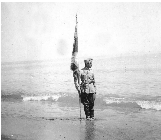
Знамето на 10 родопски полк, забито на беломорския бряг

зеделски площи българското правителство изразходва през 1941-1944 г. 205 574 119 лв. за пресушаване на блатистите места и превръщането им в обработваеми площи. Средства се отделят и за залесяване на планинските територии, обрали с ниска растителност. Окаяното положение на транспортната мрежа в региона, влошени още повече от действията на гръцката