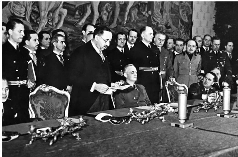
Присъединяване на България към Тристранния пакт. Министър-председателят Богдан Филев чете реч на церемонията, 1 март 1941 г.

През февруари 1941 г. обстановката на Балканите се усложнява. Упоритата съпротива на Гърция и опасността от дебаркиране на английски войски, които да отворят нов европейски фронт, принуждава Германия да упражни натиск над България и на 1 март 1941 г. във Виена в една от залите на двореца „Белведере“, министър-председателят проф. Богдан Филев подписва споразумение за присъединяване на Царство България към Тристранния пакт Рим-Берлин-Токио. Срещу това страната ни получава обещание за излаз на Бяло море от устието на р. Струма до устието на р. Марица. Притеснението на Гърция, че българската територия може да бъде използвана като плацдарм за германско нахлуване, вече се превръща в реална опасност.