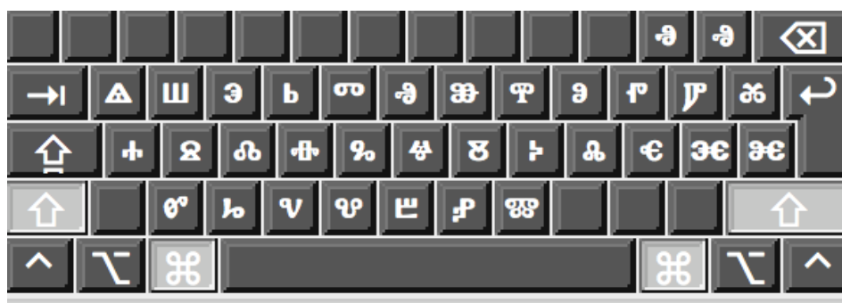
Tastatura autorului pentru glagolitic, forma finală